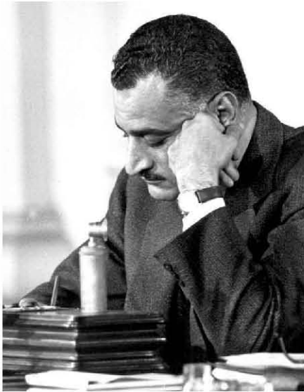
حديث عبد الناصر لاجتماع اللجنة التحضيرية